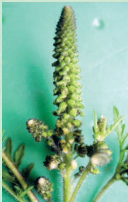
August und September ist die Hauptblütezeit, späte Pflanzen blühen bis im Oktober.